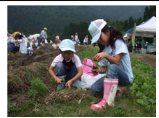
らっきょう掘り体験