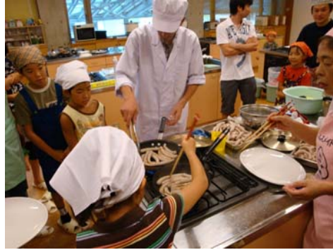
ウインナー作り体験