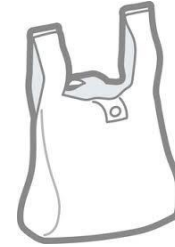
ウェットティッシュ・ゴミ袋