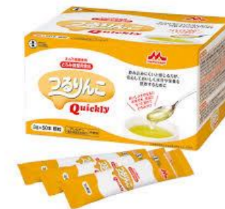
とろみ剤サンプル