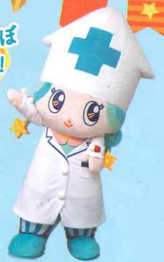
富山県薬剤師会 マスコットキャラクター 富薬(とみやく)ヒカリちゃん