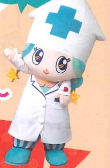
富山県薬剤師会マスコットキャラクター 富薬(とみやく) ヒカリちゃん